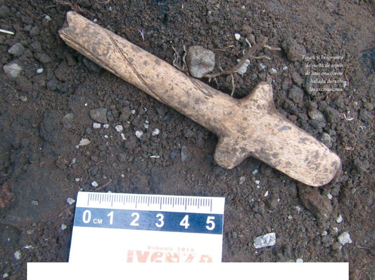
Figura 2: Fragmento de punta de arpón de base cruciforme hallada durante las excavaciones.