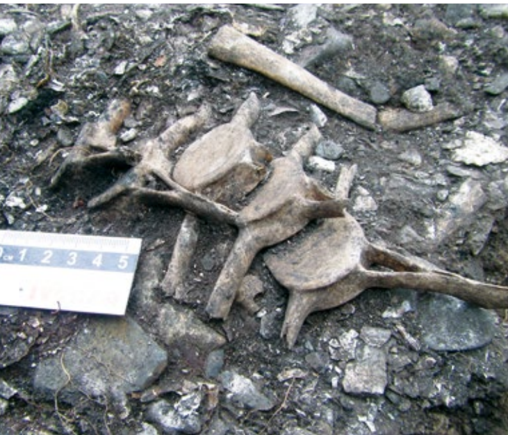
Figura 4: Vértebra semiarticuladas de un cetáceo pequeño, alguna especie de delfín.