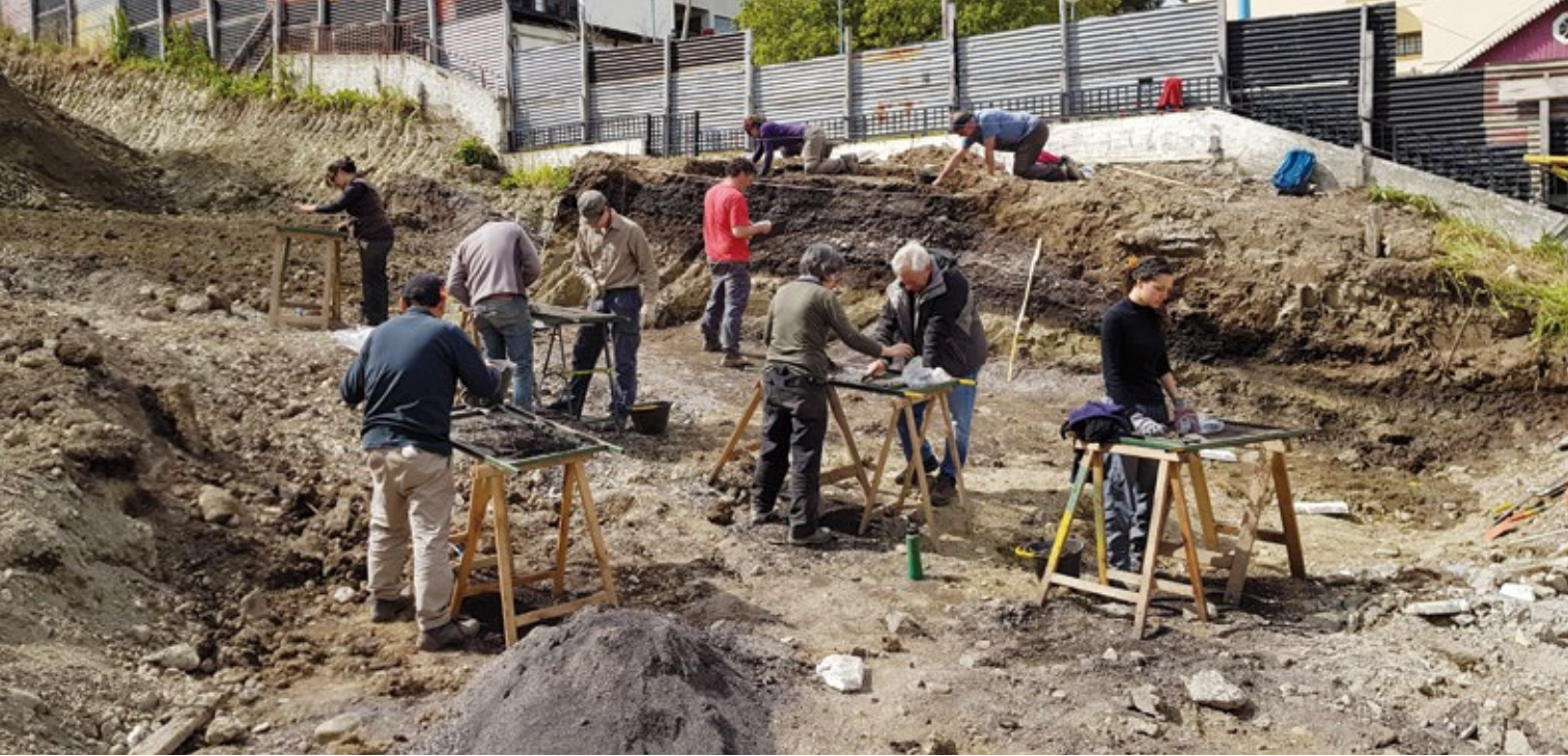
Figura 3: Tareas de excavación realizadas en enero de 2019.

Los trabajos de rescate arqueológico se concretaron en enero de 2019 y permitieron registrar la estructura estratigráfica de cuatro diferentes sectores de lo que habría correspondido a un sitio continuo de grandes dimensiones. La parte más significativa de los trabajos de excavación se desarrolló sobre un gran conchero cuya extensión original desconocemos, pero que presumiblemente habría abarcado buena parte de varios de los lotes que hoy se emplazan sobre la calle San Martín.