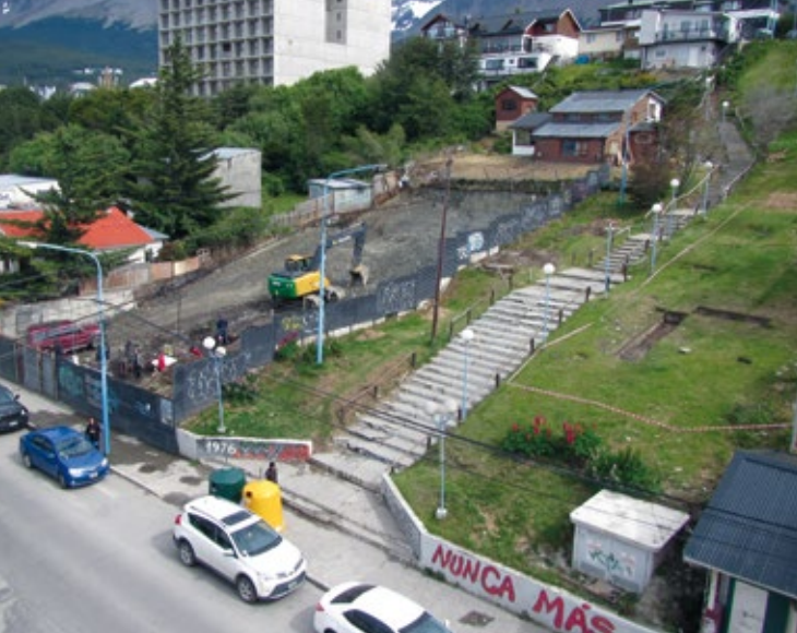
Figura 1: Emplazamiento del sitio SADOS.

Los ambientes costeros en todas partes del mundo concentran gran cantidad de sitios arqueológicos . Estos espacios han sido recurrentemente escogidos por las poblaciones humanas para asentarse, sin dudas por la oferta de recursos vitales para la supervivencia que puede hallarse en estos ambientes, aunque seguramente este no haya sido el único motivo. La costa norte del Canal Beagle no es la excepción, ya que constituye una de las zonas con mayor densidad y riqueza arqueológica